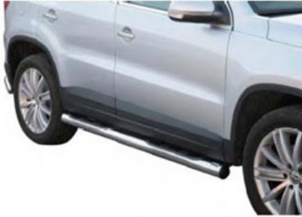
Schwellerrohr mit Tritt GP (rund)