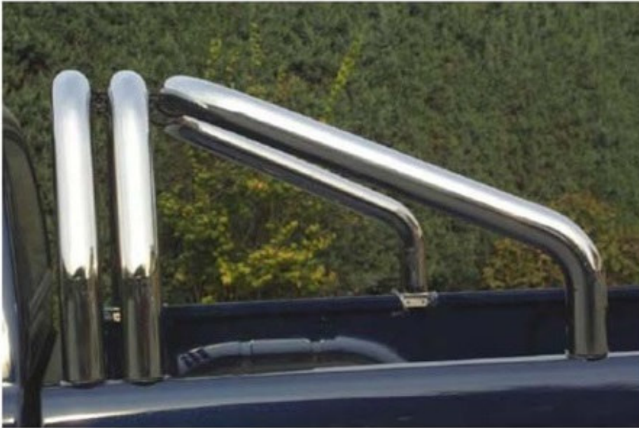
Ladeflächenbügel RLSS / RLUP (3-Rohr-Variante)