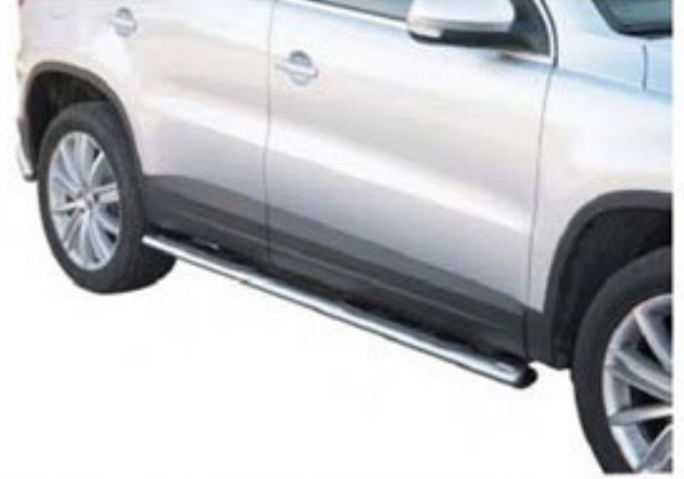
Schwellerrohr mit Tritt GPO / DSP (oval)