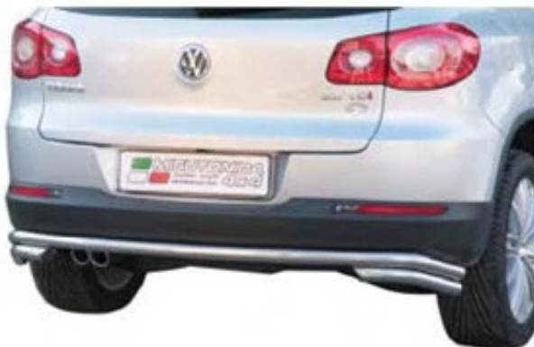
Heckrohr mittig 2PP / DBR / DP2