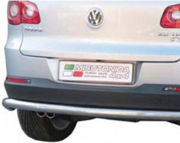
Heckrohr mittig PP1 / PPC