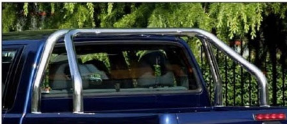
Ladeflächenbügel RLSS / RLUP (2-Rohr-Variante)