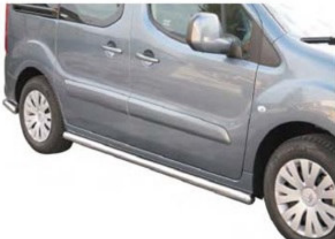
Schwellerrohr TPS / TPSO / SP (rund oder oval)